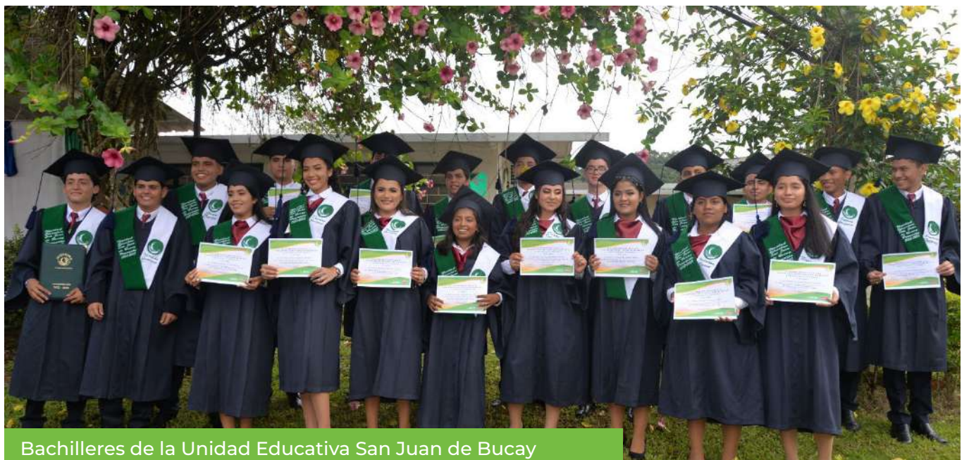
Bachilleres de la Unidad Educativa San Juan de Bucay

Como Pronaca aportamos al bienestar y desarrollo de las personas por lo que nos sumamos a las felicitamos de los nuevos bachilleres. ¡Nos sentimos muy orgullosos de su progreso y del gran aporte que serán para el país!