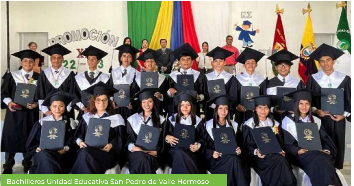
Bachilleres Unidad Educativa San Pedro de Valle Hermoso

De acuerdo al régimen de educación ciclo costa, las unidades educativas San Pedro de Valle Hermoso y San Juan de Bucay de la Fundación San Luis, realizaron sus ceremonias de graduación donde 18 y 22 jóvenes se incorporaron respectivamente, como bachilleres en ciencias de la República del Ecuador.