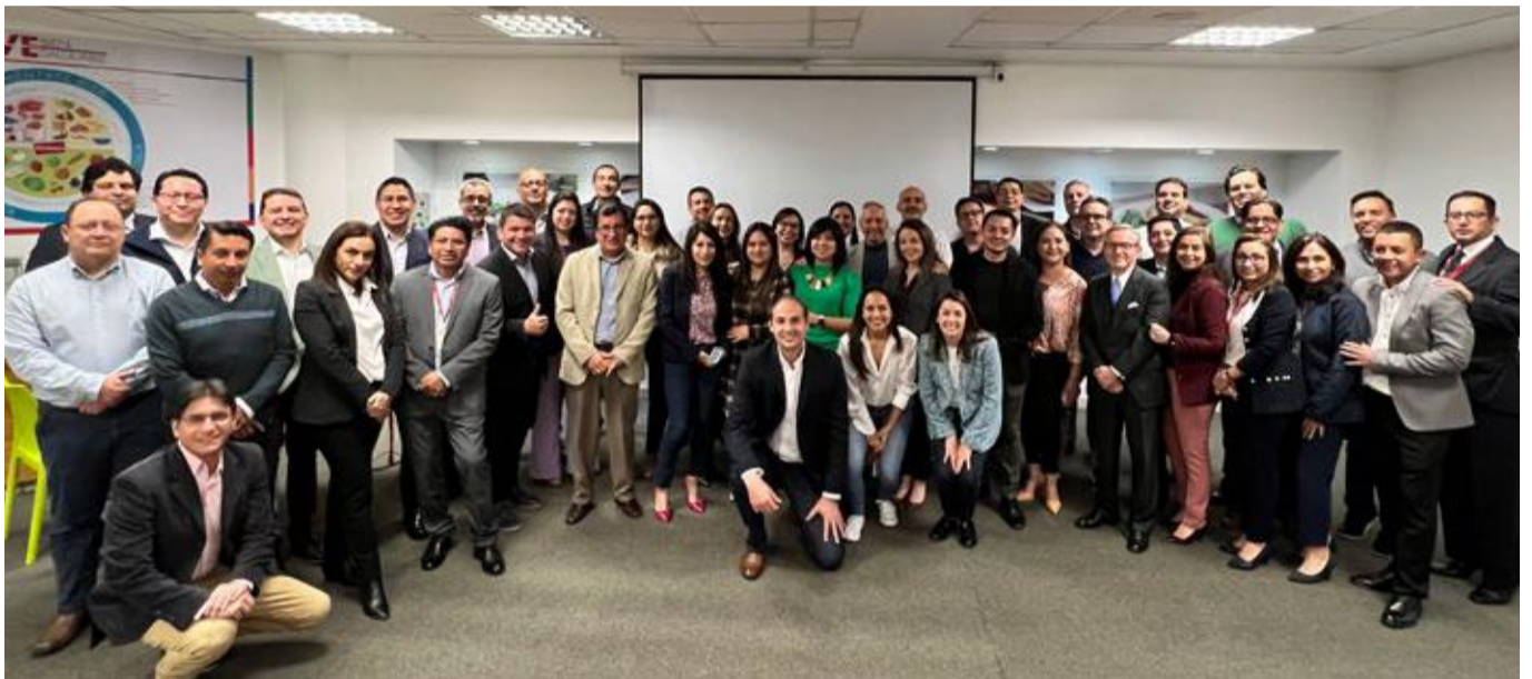
Equipos multidisciplinarios de implementación.

Como parte de la transformación digital iniciada hace algunos meses en la compañía, se ha realizado el lanzamiento de los dos primeros proyectos que permitirán dar paso a esta nueva era. Para esto, el Proyecto Core Digital – SAP permitirá reformular y automatizar procesos a través de una solución digital de clase mundial que contempla las mejores prácticas internas y de la industria. El alcance de este proyecto está contemplado en 4 fases las cuales involucran a finanzas corporativas, abastecimiento agrícola y compras estratégicas, comercial, consumo hogar y a los diferentes negocios de la compañía.